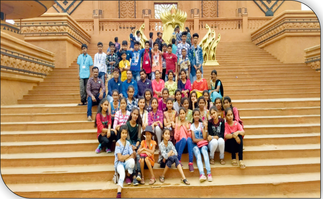
शैक्षणिक सहल हैदराबाद ( २०१९-२०२० )