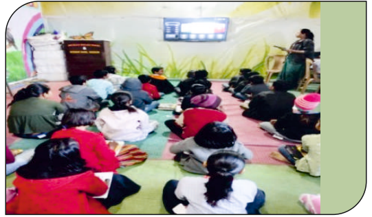
सुसज्य डीजिटल रूम