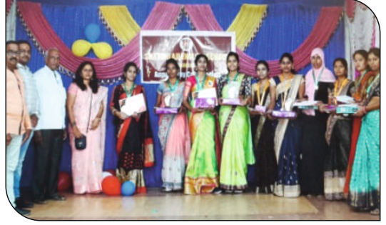
पालकांचे बक्षीस वितरण करताना