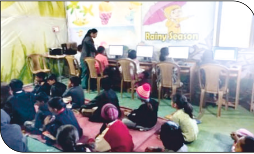
सुसज्य कॉम्प्युटर लॅब