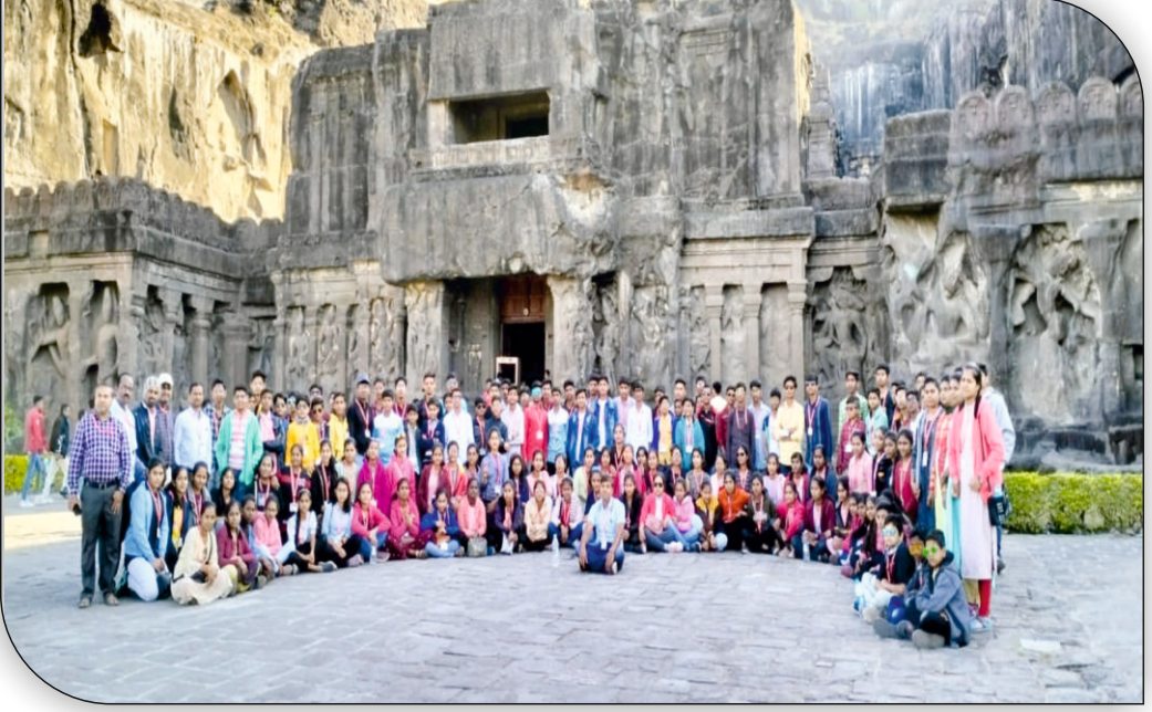
शैक्षणिक सहल अजिंठा वेरूळ ( २०२२-२०२३ )