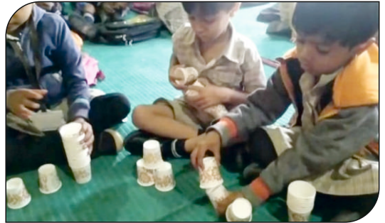
विद्यार्थी कृती करतांना